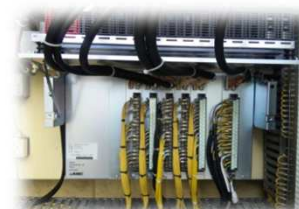
↑上段ベースを開いた状態