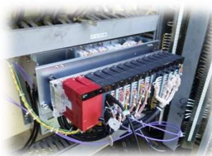
←上段ベースにPLCが取り付けられた状態