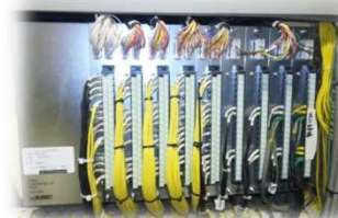
←上段ベースの無いタイプ。